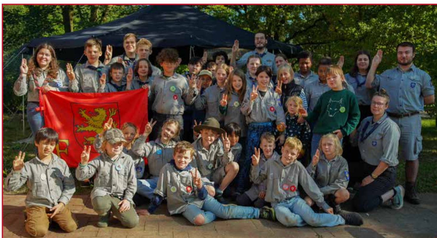
Gruppenfoto vom Stammeswochenende 2024