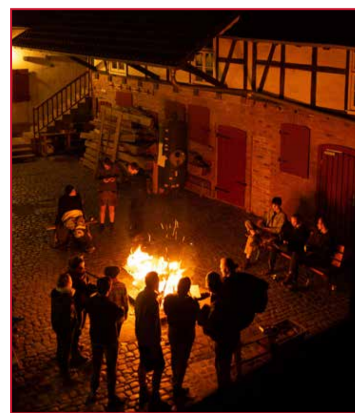
Abendstimmung am Lagerfeuer

Mit der Neugründung des Stammes hat sich die Pfadfinderschaft auch für weibliche Mitglieder geöffnet und so werden auch die Freizeitaktivitäten gemeinsam geplant und gestaltet.