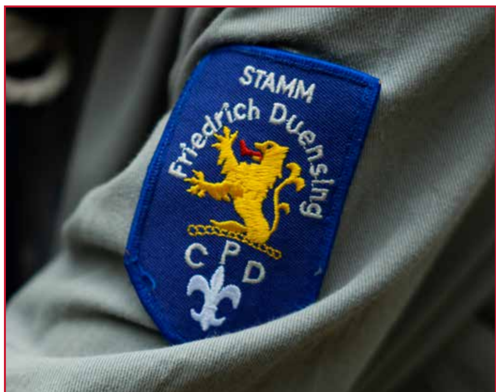
Stammeswappen: Stamm Friedrich Duensing