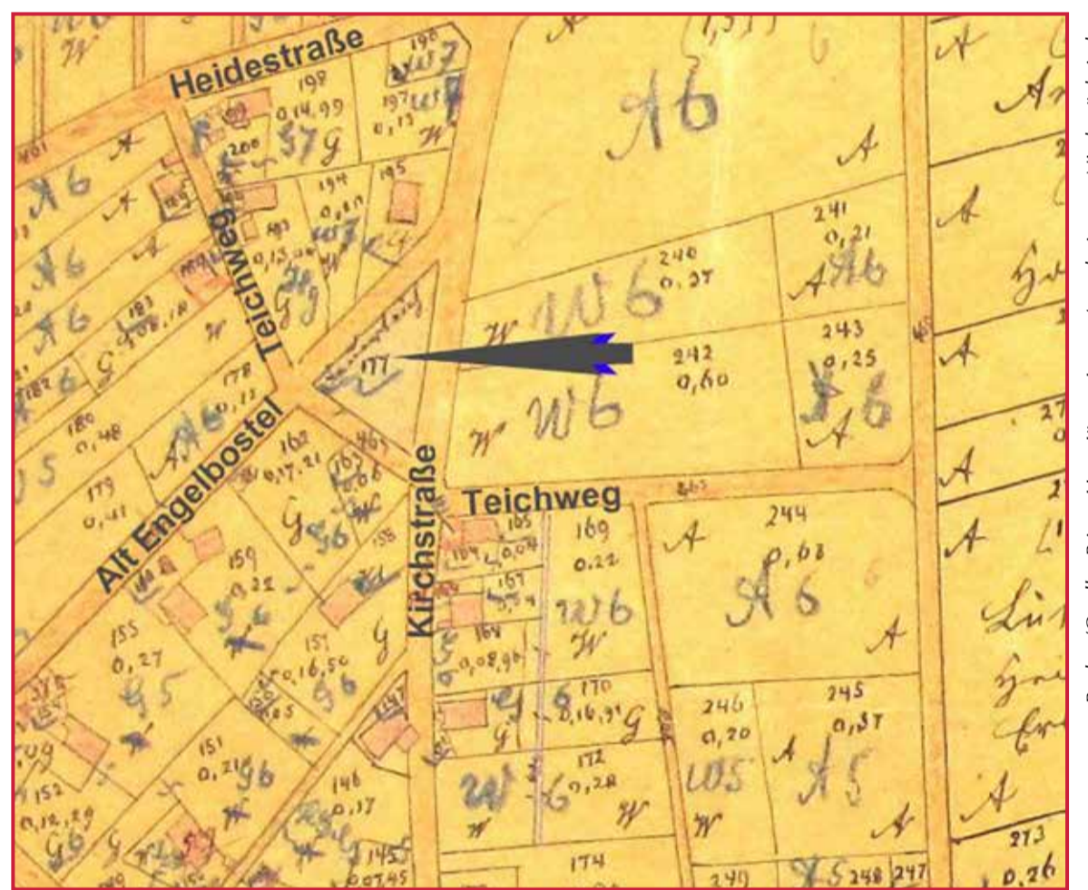
Ausschnitt aus einer Katasterkarte von 1872.

Rechte/Quelle: Privat, Hans-Jürgen Jagau, Abb. 1: Auszug aus den Geobasisdaten des Landesamtes für Geoinformation und Landesvermessung Niedersachsen (1832)