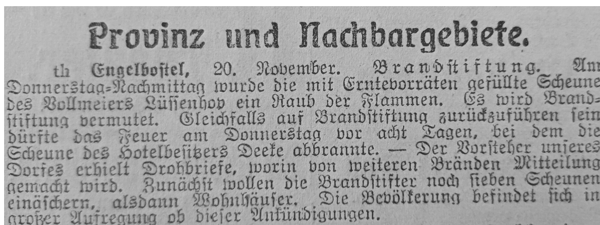
Meldung im Hannoverschen Tageblatt vom 21. November 1908 über die Häufung von Bränden in Engelbostel, vermutlich ausgelöst durch Brandstiftungen