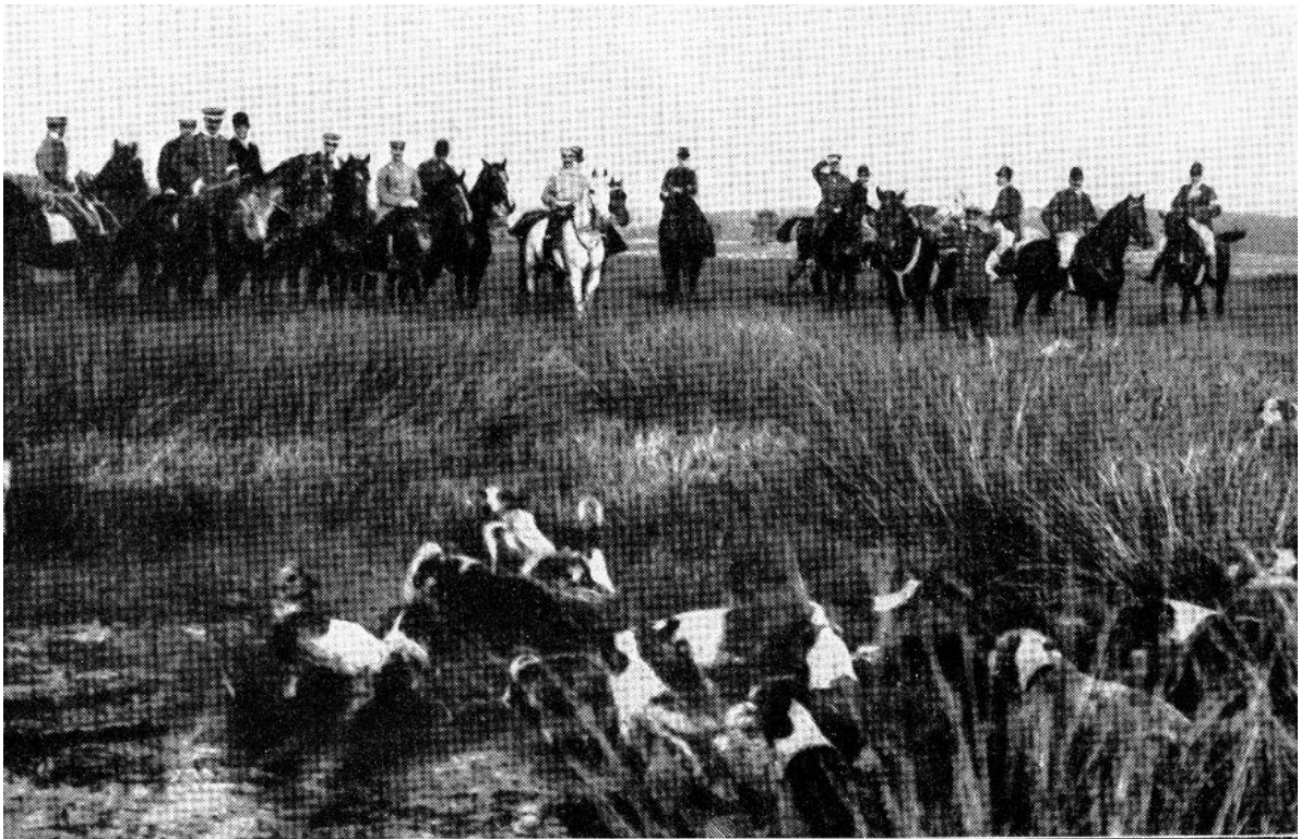
Die Meute hat den ausgesetzten Keiler erreicht