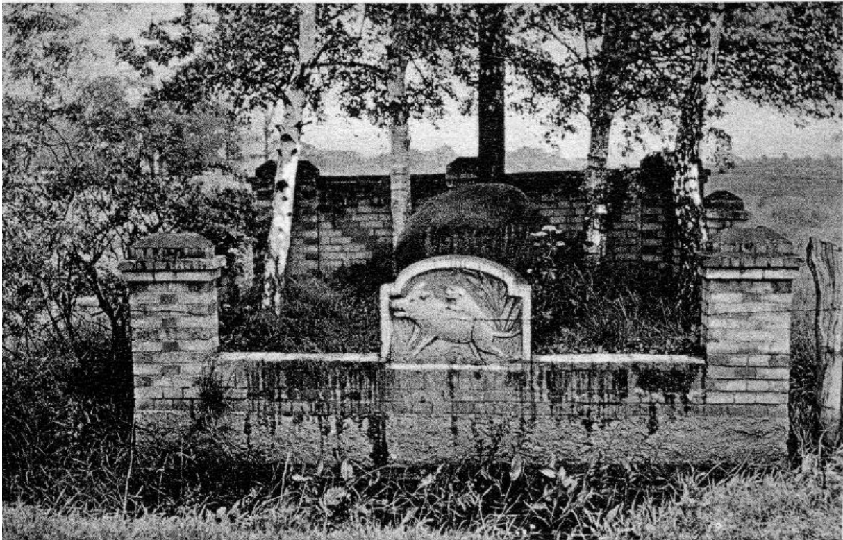
Kronprinz Wilhelm Hubertus 1867 · Bauernschaft Hainhaus

Denkwürdig wurde diese bereits bei Hainhaus endende Jagd durch Teilnahme des Kronprinzen, der auch – sicher dank geeigneter Regie der Jagd – als erster am Wild war und den zweijährigen Keiler abfing. Der Offizier-Jagdverein sowie Bürger aus Hainhaus und den umliegenden Orten nahmen dies Ereignis zum Anlass, ein größeres Denkmal zu errichten. Ein Teil der oben abgebildeten Herren war möglicherweise bei dessen Einweihung zugegen.