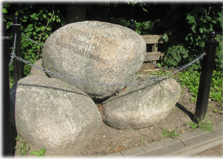
Aktueller Zustand des Denkmals in Hainhaus.

Kronprinz Wilhelm erkannte vermutlich den huldigenden Charakter der für ihn veranstalteten Jagd und nahm „gnädig“ daran teil. In seinem Jagdbuch ii berichtete er weniger erbaut von ähnlicher Jagd auf Wildschweine in Indien, bei der die Tiere vom Pferd aus mit Lanzen abgestochen wurden. Nach eigenem Bekunden in diesem Buch war er eher ein Mann, der Waffen zu gebrauchen weiß, und weniger ein Mann „der Feder“. Damit sprach er vermutlich tiefergehende intellektuelle Anstrengungen an. Er war eben – wie wir alle – ein Kind seiner Zeit. Um 1900 wurde nun mal das Waffenhandwerk, „die schimmernde Wehr“ besonders hoch geschätzt.