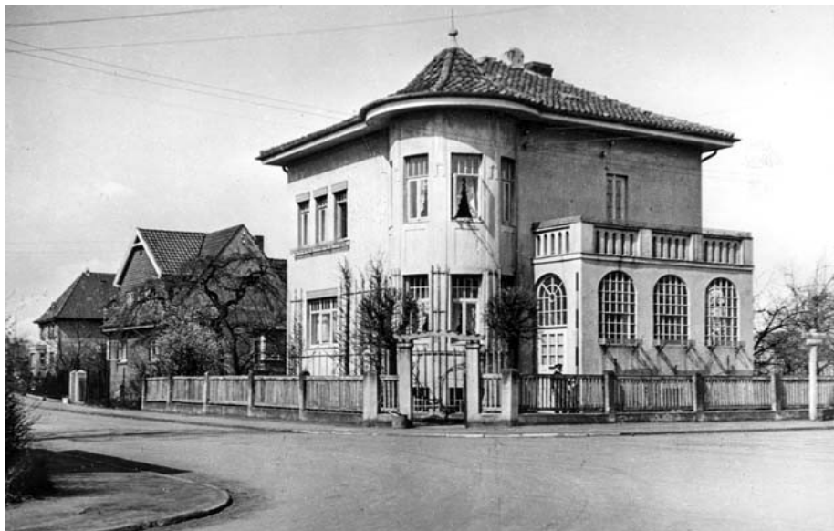
ehemaliges Eckhaus Beethoven-Ecke Bach- straße in Wiesenau (im Krieg zerstört)

Kurz nach der Wende zum 20. Jahrhundert erlebten erstaunte Betrachter eine Bautätigkeit, die keinen Wohnraum für die zuziehenden Arbeiter mit ihren Familien schaffte, sondern einem höhergestellten Personenkreis vorbehalten war. Es entstanden, nicht etwa in einem gesonderten Quartier, sondern an verschiedenen Stellen über das Gemeindegebiet verteilt, stattliche Villen. Betuchte Hannoveraner zog es ins Umland, ins Grüne, wo man nach täglicher Geschäftigkeit oder an einem verlängerten Wochenende der Hektik der Großstadt entfliehen konnte. Es bildete sich kein einheitlicher Baustil heraus. Der Bauherr folgte seinen Neigungen und Wünschen und unterwarf sich keiner gleichmachenden Vorgabe. So wurden Fassaden mit Elementen des Jugendstils geschmückt, nahmen Anleihen am Historismus, oder kamen modernistisch schlicht von geraden Konturen geprägt, daher. Von allem hatte Langenhagen etwas zu bieten. Viele Beispiele haben die Kriege überdauert und sind heute liebevoll erhalten und gepflegt.