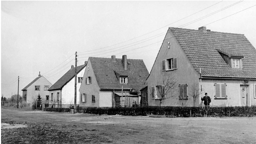
Siedlungshäuser an der Veilchenstraße;

Langenhagen angefertigt, die sich auf Einzelheiten an unseren Wohnhäusern jeden Alters erstreckt. Aus diesen Unterlagen soll in Zukunft der Haustyp entwickelt werden, der in unsere Landschaft passt. Wenn auch in Langenhagen auf baulichem Gebiet nicht viel vermurkst ist, so haben wir doch noch in den letzten Jahren zu viel Häuser gebaut, die kein Gesicht haben. Es liegt dieses oft nur an Kleinigkeiten, z.B. an der Gesimsgestaltung, an der Dachneigung, dem Dachüberfall [-überstand], an der Entwicklung des Hauseinganges. Diese Vorarbeiten werden heute von einem namhaften Städtebauer [gemeint ist Architekt Georg Wimmelmann] geleistet." 11