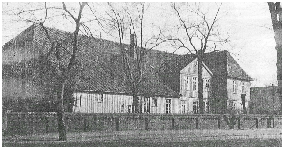
Hofstelle Bestenbroer, Langenhagen, Walsroder Straße Nr. 32, heute Nr. 147 (im Krieg zerstört)

Mehrere Landwirte errichteten rechtwinklig vor Kopf ihres alten Bauernhauses ein zweigeschossiges Wohnhaus, das nun neuzeitlichen Wohnansprüchen genügte. Hier gab es eine separate Küche mit modernem Herd und ein separates Badezimmer. Das Häuschen mit dem Herzen hatte ebenfalls ausgedient. Nun gab es Toiletten mit Sanitärporzellan und Wasserspülung. In der Dorfgemeinschaft waren diese Neuerungen revolutionär. Auf den Hofstellen wie bei Bestenbroer und Biester zog die "Moderne" ein. Diese Häuser hatten sogar teilweise Zentralheizung und eine zentrale Warmwasserbereitung.