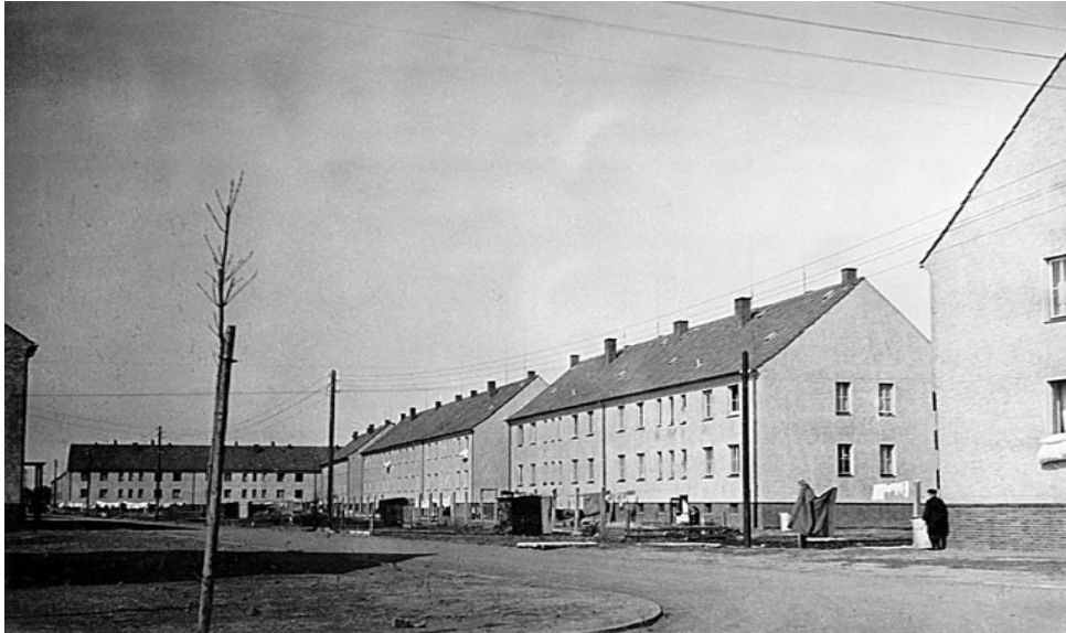
zweigeschossige Bebauung entlang der Wilhelm-Busch-Straße

Wiesenu ist nicht mehr wiederzuerkennen, Wohnblöcke schießen wie Pilze aus der Erde, Häuser an der Hackethalstraße , der Wilhelm-Busch-Straße , der Friedrich-Ebert-Straße und An der Autobahn . Alle Straßennamen tragen zu dieser Zeit Namen von Nazi-Größen.