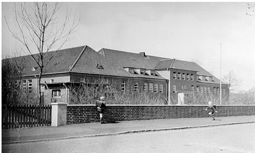
Volksschule II (Brinker Schule) an der Dorfstraße, der heutigen Angerstraße; 1938 eingeweiht

Inzwischen ist Hermann Ebeling Bürgermeister von Langenhagen und baut für die früher eigenständigen, jetzt vereinigten Gemeindeteile, eine funktionierende Gemeindeverwaltung auf. Auf Grund expandierender Gewerbe- und Industriebetriebe, vor allem in Wiesenau, nimmt die Einwohnerzahl stark zu. Im Bereich Stader-Land-Straße und Heinrich-Heine-Straße wird die Heereswaffenwerkstatt eingerichtet (nach dem Krieg werden hieraus die Langenhagen-Barracks britischer Truppenteile). Die Kriegswirtschaft läuft bereits auf vollen Touren. Im gesamten Reich werden Arbeitskräfte angeworben, für die mit ihren Familien Wohnraum geschaffen werden muss.