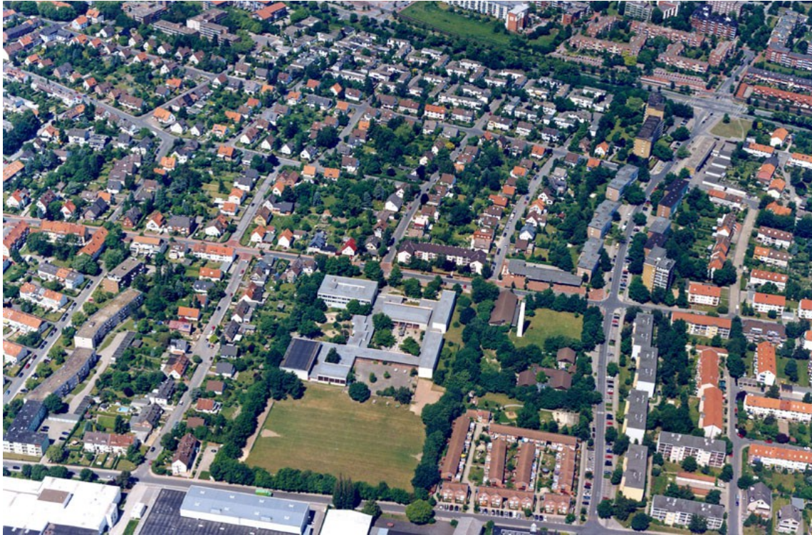
Stadtteil Langenforth- heutige Situation; im Zentrum die Friedrich-Ebert-Schule