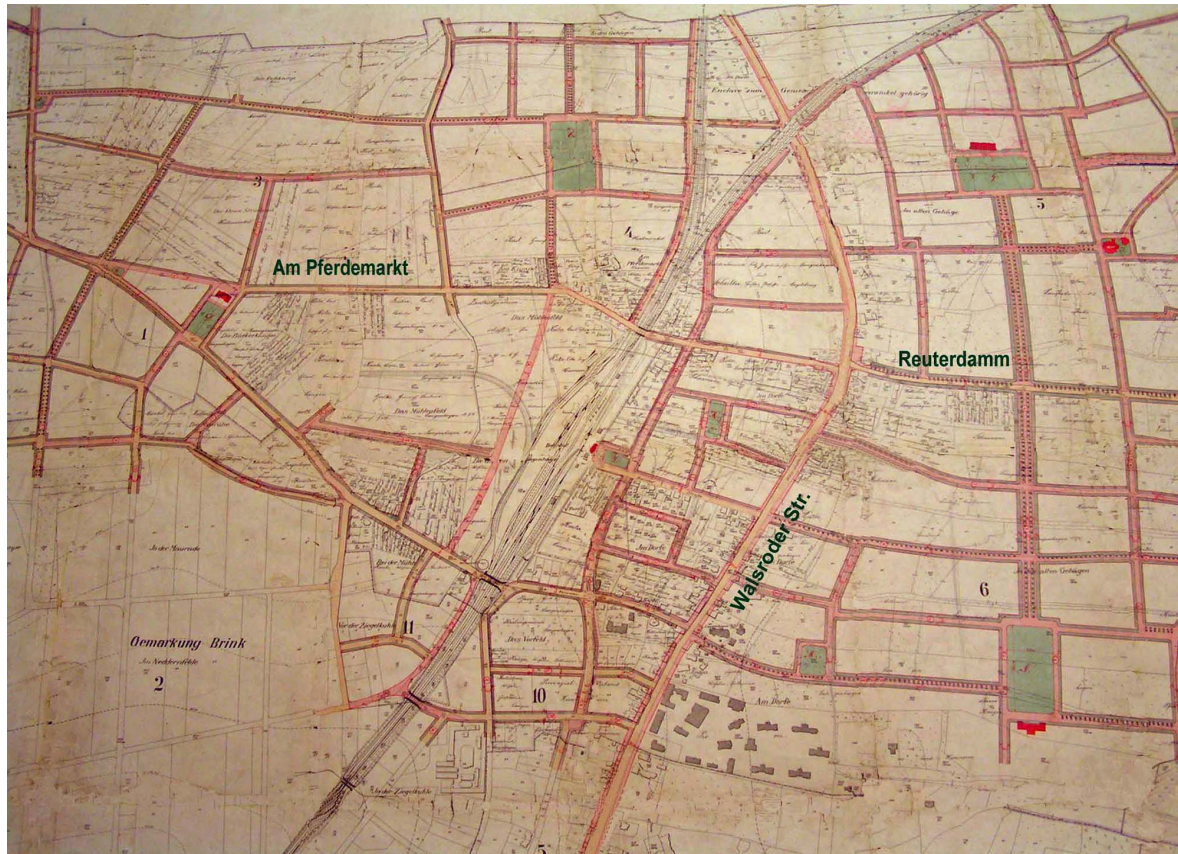
Fluchtlinienplan von 1919 6

Das zentrale Entwicklungskreuz bildeten die Bahnhofstraße , die Walsroder Straße und die nach Osten verlängerte Bahnhofstraße , die heutige Leibnizstraße .