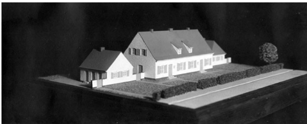
Modell eines Doppelhauses mit separatem Stallbau in Langenhagen

Noch in Friedenszeiten, 1938, beauftragt Bürgermeister Ebeling den hannoverschen Architekten Georg Wimmelmann mit der Planung eines Siedlungshaustyps, mit dem der Charakter der Gartenstadt Langenhagen unterstrichen werden soll. Wimmelmann entwickelt einen Haustyp als Einzel- oder Doppelhaus mit separatem Stallgebäude. 9 Als Grundstücksgröße werden ca. 600 qm vorgesehen. Die Stallgebäude sollten der Viehhaltung dienen, die Flächen waren für Obstbäume und Gemüse vorgesehen, als Grundlage für eine gewisse Selbstversorgung.