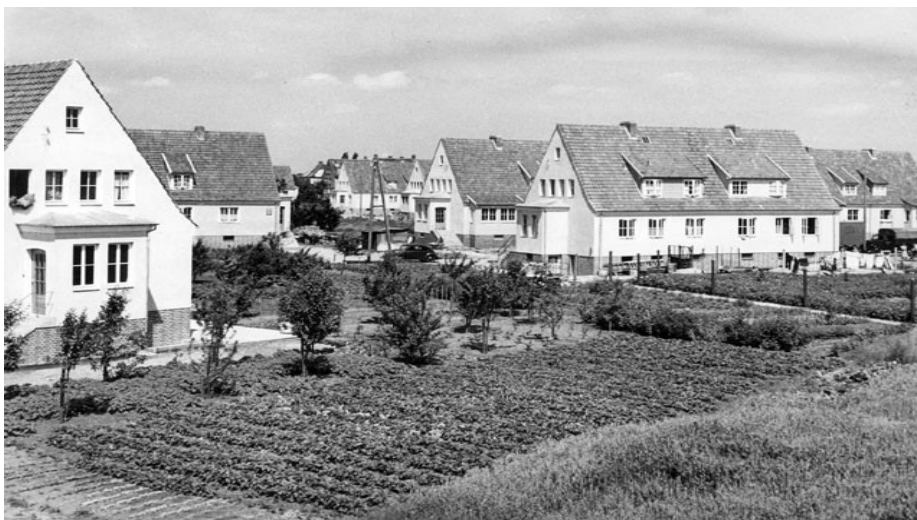
Häuser der Volksparksiedlung zwischen der Niedersachsenstraße und der Manrade

Nach dem II. Weltkrieg entschließt sich die Gemeinde die Flächen des Volksparks mit Siedlungshäusern in einheitlicher Bauweise in großen Grundstücken zu bebauen. Es entstehen Mitte der 50er Jahre eineinhalbgeschossige Wohnhäuser mit ausgebautem Dachgeschoss als Einliegerwohnungen südlich der Niedersachsenstraße zwischen dem Libellen- und dem Immenweg .