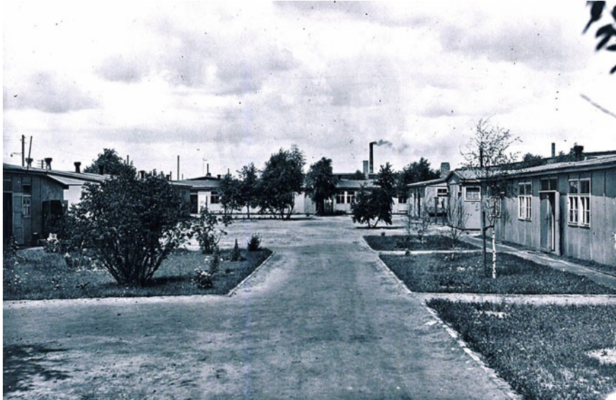
Barackensiedlung "Osterrieder Hof"; nach dem II. Weltkrieg noch bis zum Ende der 50er Jahre Flüchtlingsunterkunft

Noch in Friedenszeiten, 1938, beauftragt Bürgermeister Ebeling den hannoverschen Architekten Georg Wimmelmann mit der Planung eines Siedlungshaustyps, mit dem der Charakter der Gartenstadt Langenhagen unterstrichen werden soll. Wimmelmann entwickelt einen Haustyp als Einzel- oder Doppelhaus mit separatem Stallgebäude. 9 Als Grundstücksgröße werden ca. 600 qm vorgesehen. Die Stallgebäude sollten der Viehhaltung dienen, die Flächen waren für Obstbäume und Gemüse vorgesehen, als Grundlage für eine gewisse Selbstversorgung.