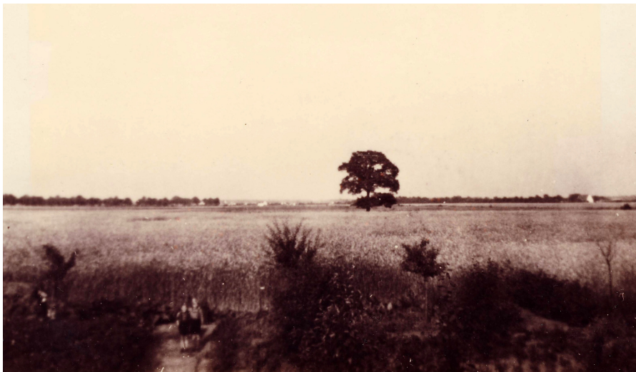
Langenforth östlich der Straße "Deisterweg" Anfang der 50er Jahre; im Hintergrund die Bäume an der Bothfelder Straße, rechts im Bild die ehemalige Stadtgärtnerei In den Kolkwiesen 13

In Langenforth, in dem Gebiet zwischen Sollingweg und der Kurt-Schumacher-Allee , stand ursprünglich nur ein einziger großer Baum, eine majestätische Eiche, ansonsten war dieses Gebiet landwirtschaftliche Nutzfläche. Diese Eiche steht noch heute in einem Garten am Havelweg und hat die Zeitläufte überdauert.