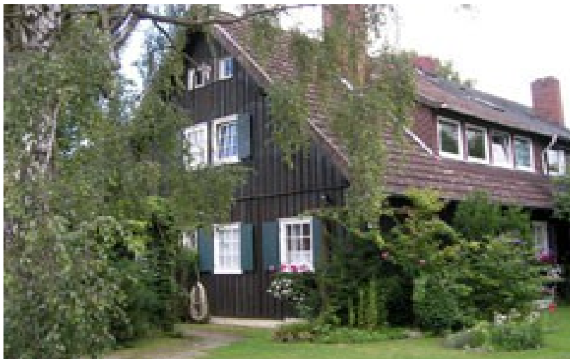
Haus H. Ruprecht, Wietzgrund Nr. 6 (ehemalige Schott-Siedlung)

Richtung Flughafen Evershorst entstehen Wohnhäuser für Unteroffiziere und Mannschaften an der Gutenbergstraße und an der Dünneriede , Offiziershäuser werden am Reuterdamm gebaut. An der damaligen Erwin-Breimer-Straße , der heutigen Theodor-Heuss-Straße wird eine Siedlung für das Focke-Wulf-Erprobungskommando, das auf dem Fliegerhorst stationiert ist, errichtet. Es entstehen 28 Einzel- und Doppelhäuser. Auf deren Trümmer werden nach dem Krieg Werkwohnungen für Schott-Mitarbeiter gebaut, die sogenannte "Schott-Siedlung".