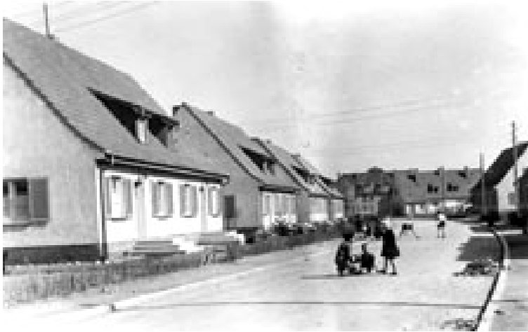
Doppelhäuser an der Tulpenstraße; 1939 bezogen

Ebeling äußert 1941 zu den Grundstücksgößen: "Wir werden in Zukunft nicht mehr so stark mit dem Land zu geizen brauchen, [mit Hinweis auf die Landeroberungen der Wehrmacht im Osten] wie wir es bis zu diesem Kriege leider mussten, d.h. für uns, dass wir in Zukunft zu jeder Wohnung eine Landzulage geben können, so dass der Charakter der Gemeinde als Gartenstadt immer mehr ausgeprägt wird". Weiter: "Wir werden uns ein Ortsbild schaffen, das in jeder Weise ausgeglichen und schön ist, und vor allen Dingen wollen wir noch mehr als bisher viel Grün in der Gemeinde sehen." 10