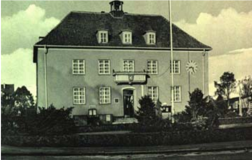
Rathaus der ehemaligen Gemeinde Brink, 1937 eingeweiht; ab April 1938 Rathaus der Gemeinde Langenhagen