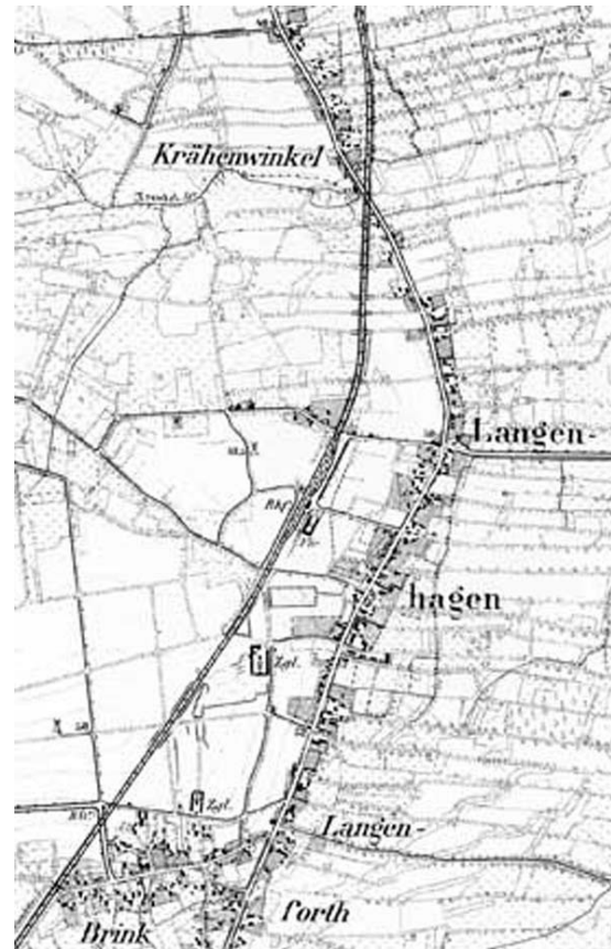
Kur-Hannoversche Landesaufnahme von 1785