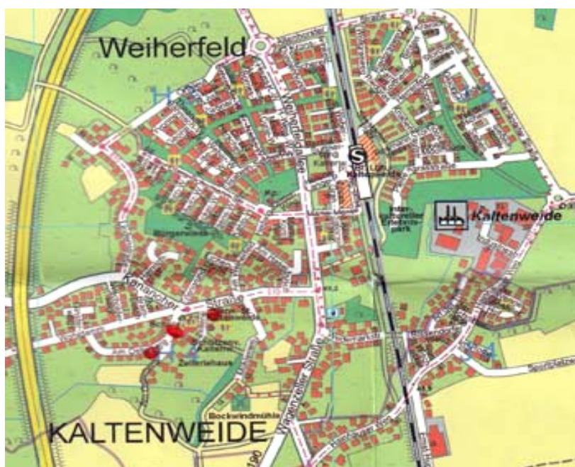
Das Siedlungsgebiet "Weiherfeld" in Kaltenweide mit grünen Freiflächen unter anderem den sogenannten "grünen Fingern"

Bis in die aktuellen Siedlungsprojekte, wie z.B. die Entwicklung des "Weiherfeldes", wirkt sich der Gartenstadt-Gedanke aus. Weil in diesem Siedlungsgebiet wegen der hohen Baulandpreise die Grundstücke verhältnismäßig klein sind und somit üppiges Grün, vor allem hohe Bäume, auf Privatgrund kaum zu realisieren sind, wird dieser Mangel durch öffentliches Grün kompensiert.